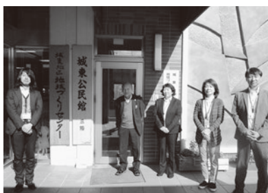
地域づくりセンター 公民館職員一同