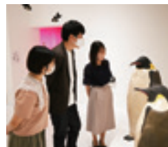
大曾根俊輔展示室