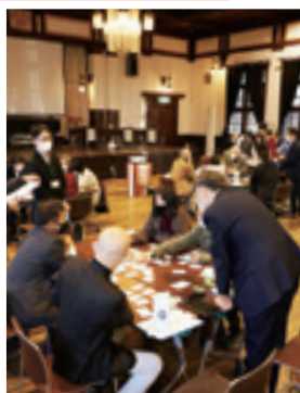
市民フォーラムの様子