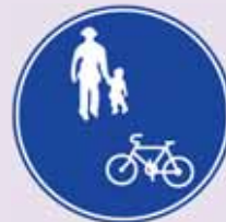
「自転車通行可」の道路標識

自転車は車両です。で歩道を通行することはできません。自転車は車道が原則です。ただし、上記のような場合は、歩道を通ることができます。