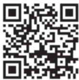
「維新のふるさと 鹿児島市」 ホームページ