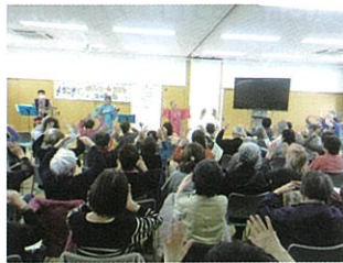
▲鎌田地区 オレンジカフェの様子

社協会費などを財源とする「つむぎちゃんプラン助成金」を活用していただき、地域福祉活動の支援を行っています。