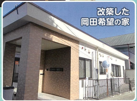
改築した 岡田希望の家