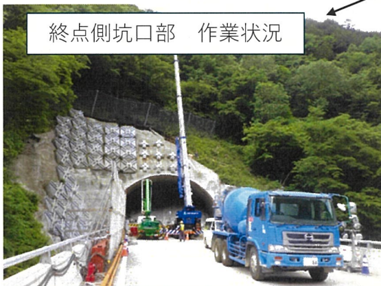
終点側坑口部 作業状況