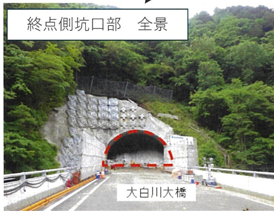
終点側坑口部 全景