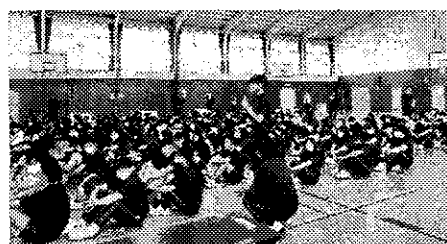
全校の前で意見を発表する生徒

をつくっていくことは、生徒一人一人の主體的な活動につながります。今回の集会を通して、日常生活のよさや課題を見つめ直し、みんなで考えていくことの大切さを実感することができました。