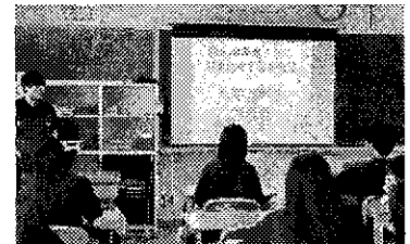
戦争に関する話をきく3年生

3年生は、総合的な学習の時間において、「平和」をテーマに探究活動を進めています。戦争の歴史や当時の人々の思いについて学びながら、平和な社会を築くために自分たちができることを考えています。7月9日には校外学習も予定されており、これまでの学習をさらに深める機会となります。過去の出来事を知ることで、現在の生活のありがたさや命の尊さについて考え、自らの生き方や社会との関わり方を見つめ直す学びにつながっています。