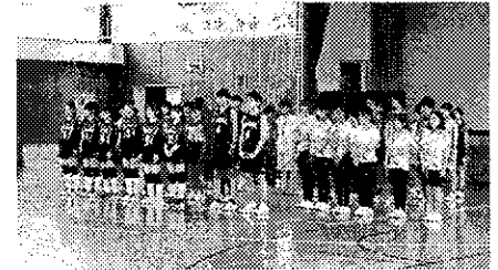
壮行会に臨む選手たち