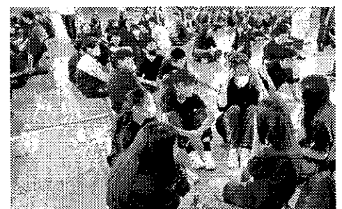
話し合いをする生徒たち

をつくっていくことは、生徒一人一人の主體的な活動につながります。今回の集会を通して、日常生活のよさや課題を見つめ直し、みんなで考えていくことの大切さを実感することができました。