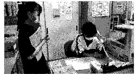
職場に電話をかける2年生の生徒

2年生は、職場体験学習に向けた事前学習に取り組んでいます。履歴書の作成では、自分の長所や意欲をどのように伝えるかを考えながら、何度も内容を見直して完成度を高めています。また、受け入れ先への電話連絡にも挑戦し、社会人として必要な言葉遣いや礼儀について学んでいます。生徒たちは緊張しながらも真剣に準備を進めており、働くことへの理解を深めるとともに、社会とのつながりを意識する貴重な機会となっています。