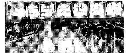
全校生徒による応援