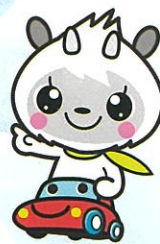
長野県交通安全協会マスコット「あんきょーくん」