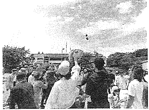
玉入れ競技に参加していただく