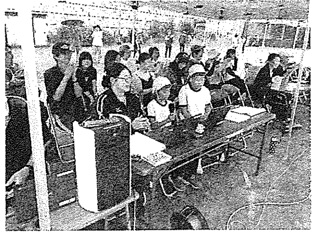
子ども達が司会進行