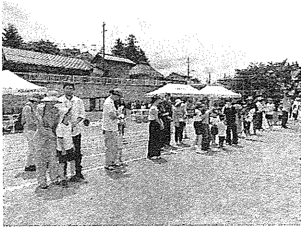
お家の人や地域の方をたくさん連れてきて