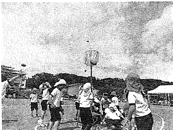
1・2年生「にんにん♪玉入れの術」玉入れ