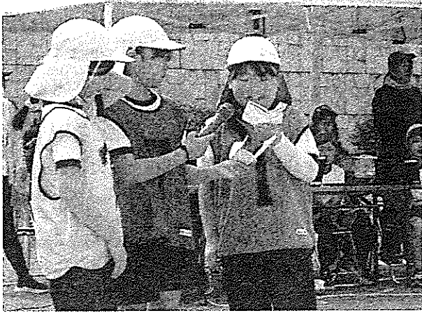
子ども達が競技の紹介