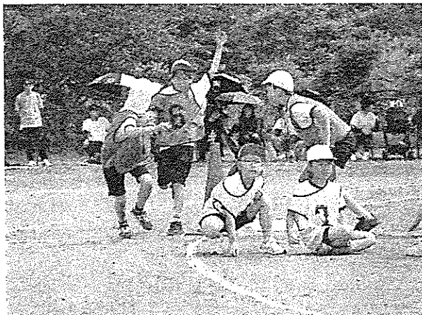
3・4年生繰り返し練習した成果で新記録を目指す

子どもたちの「やりたい!」という純粋なエネルギーは、大人の想像を遥かに超える感動を生み出します。この確かな成長のバトンを、10月16日(金)の「音楽フェス」へと繋ぎます。次なる舞台でも、私たちは子どもたちの可能性をどこまでも信じ、その情熱を全力で応援してまいります。