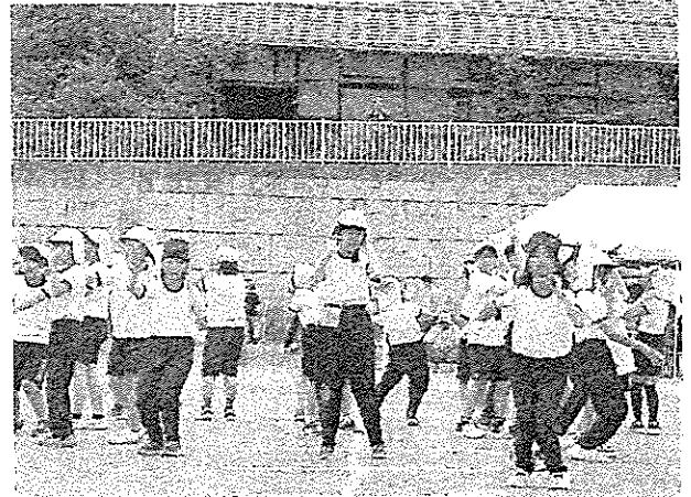
5・6年生 創作ダンス 全身で表現