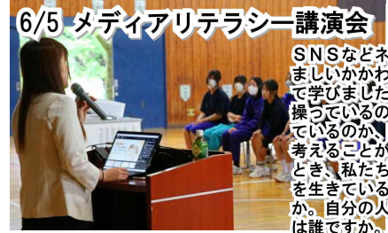
6/5 メディアリテラシー講演会 SNSなどネットとの望ましいかわり方について学びました。スマホを操っているのか、操られているのか、それさえも考えることがなくなったとき、私たちは誰の人生を生きているのでしょうか。自分の人生の主人公は誰ですか。