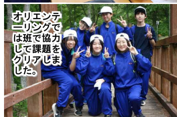
オリエンテーリングでは班で協力して課題をクリアしました。