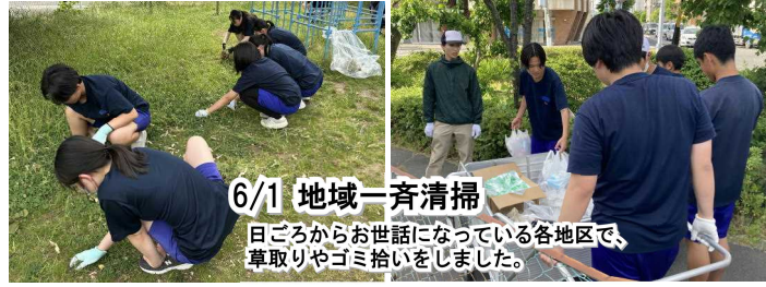
6/1 地域一斉清掃 日ごろからお世話になっている各地区で、草取りやゴミ拾いをしました。

★最近、本校の生徒の行動について、地域の方から感謝の連絡をいただきました。転倒した高齢の方を見守りながら大人に助けを求めた生徒や、道に迷った高齢の方に長時間付き添ってバス停を探した生徒がいました。どちらも相手を思いやり、行動に移した素晴らしい姿です。★今日は人権について、特に「いじめ」について考えてほしいと思います。全国のいじめ認知件数は年々増加しています。その背景には、平成26年の「いじめ防止対策推進法」があります。現在は、身体的な被害がなくても、ネット上での書き込みであっても、相手が苦痛を感じればいじめと認知されます。重大な場合は犯罪行為となることもあります。★例えば、友達の写真や動画を加工してからかたり、危険な行為を無理にさせたり、仲間同士で特定の人を笑いものにしたりすることはどうでしょうか。また、「仕返しだから」「ただのけんかだから」と暴力を振るうことは許されるでしょうか。大切なのは自分ではなく、相手がどう感じているかという想像力です。自分は冗談のつもりでも、相手にとっては深い傷になることがあります。★覚えておいてほしいことは、いじめはどの学校にも起こり得ること、いじめられる側に原因があるという考え方は誤りであること、そして内容によっては法律に触れる行為になることです。★学年が上がるにつれて、いじめの認知件数は減少する傾向があります。これは、仲間との生活を通して心が成長し、思いやりや判断力が身についていくからだと考えられます。最初に紹介した生徒たちも、そのような心の成長を積み重ねてきたのでしょう。★最後に三つお願いがあります。一つ目は、友達を大切に、相手を思いやる気持ちをもつこと。二つ目は、自分がつらい思いをしているときには勇気を出してSOSを発信すること。三つ目は、いじめを見かけたときに、自分に何ができるかを考えることです。★「バラのどげの痛みは、指に刺さった者にしか分からない」という言葉があります。心に刺さるとげも同じです。何気ない言葉や行動が、誰かを深く傷つけることがあります。相手の気持ちを想像し、思いやりをもって行動できる信明中学校をみんなでつくっていきましょう。(抜粋)