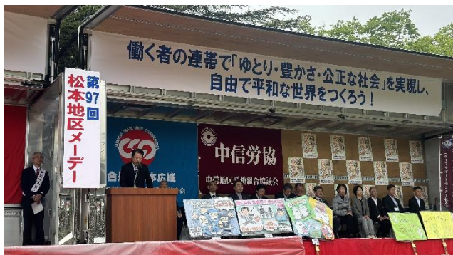
あがたの森公園の集会の様子（連合系）

5月1日に第97回メーデーが開催されました。メーデーの始まりは140年前にアメリカのシカゴで8時間労働の実現を要求したことに由来します。当日はあいにくの雨でしたが、集まった労働者は物価上昇を上回る賃上げや平和な世界の実現などを訴えました。