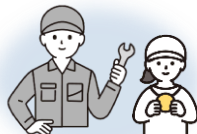
企業内で職業体験