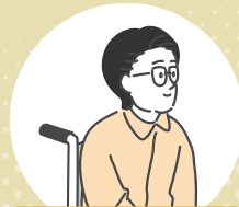
障がい・疾病がある方