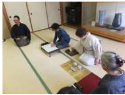
「三種香」の準備の様子

図書委員会の新たな企画として、2月26日(木)に開催しました。茶道・華道と並び「香道」のひとつとされている「香道」を知りたい、体験したいの思いから気軽に参加できるように企画しました。講師は志野流香道松本道場の先生方です。