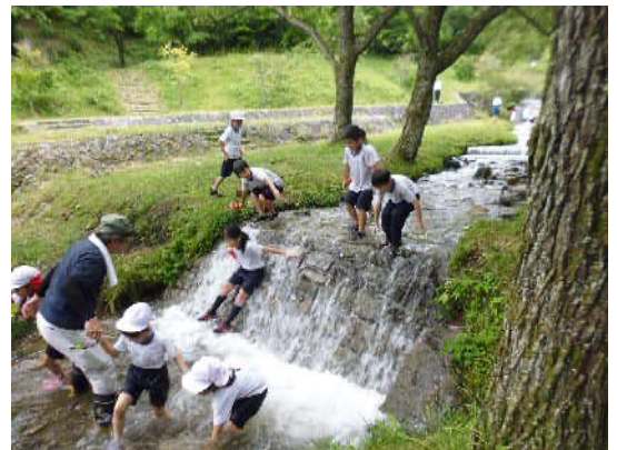
令和7年度の様子(牛伏川 水遊びの広場)

【問合せ・申込み】内田公民館 TEL 58-2494 FAX 85-1071 Email uchida-k@city.matsumoto.lg.jp