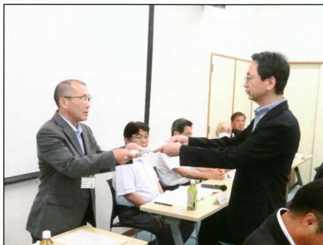
長野国道事務所へ要望書を手交