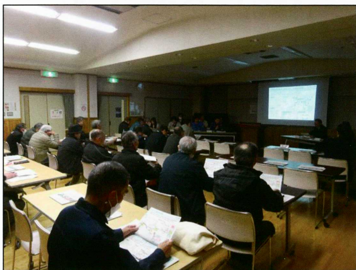
新村地区対策委員会の様子 (令和8年3月10日)

沿線4地区（島立・和田・新村・波田）の対策委員会が令和8年3月9日から12日にかけて開催されました。松本波田道路をはじめ、関連事業である松本環状高家線（仮称）新村バイパスや追加IC、中部縦貫自動車道先線（波田～中ノ湯）の状況について、各事業者から説明を行いました。