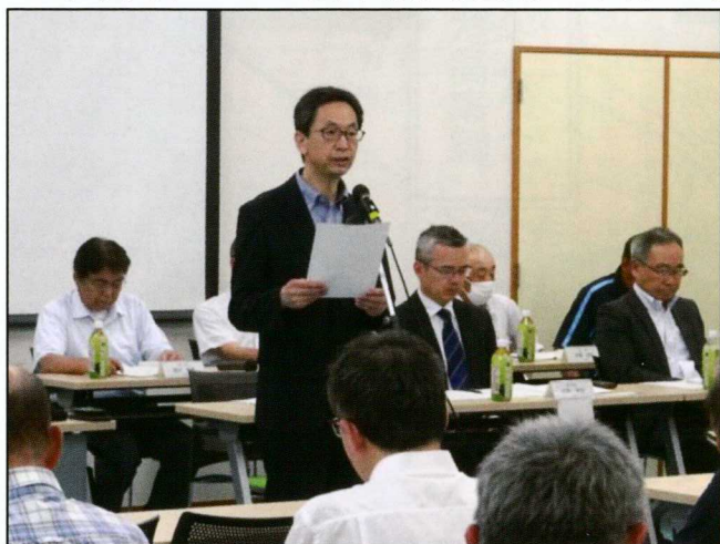
あいさつを行う奥原会長