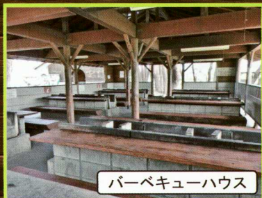
バーベキューハウス

※特盛セット・贅沢セット注文の場合、中学生以上は全員の注文、小学生は半数以上の注文が必須となります。セットをご注文いただかないお子様の備品はございません。また、席料が発生致します。 ※ドリンクの事前お預かり、保冷はお断り致します。 ※BBQ施設は雨天時に吹き込む可能性があります。雨天対策は各自にてご対応ください。雨天によるキャンセルは出来かねますので予めご了承ください。お客様判断により中止される場合は食材のみのお渡しとなります。