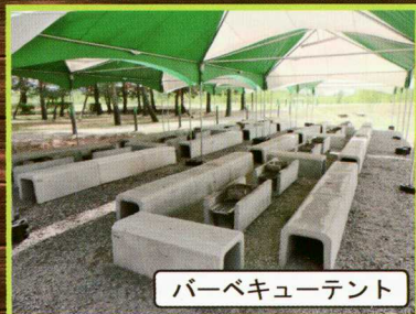
バーベキューテント