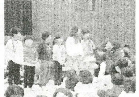
プレゼントされたメダルを胸に、元気よくお礼の言葉が言えました