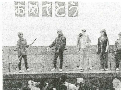
波田レンジャーが学校での過ごし方を教えてくれました