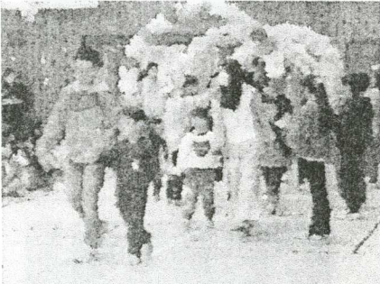
6年生と一緒に、5年生がつくったアーチをくぐって入場

6年生と一緒に、5年生がつくったアーチをくぐり、1年生が体育館へ入場しました。6年生からプレゼントのメダルがかけられると、講堂が1年生の笑顔でいっぱいになりました。6年生の発表では、波田レンジャーが登場し、学校での過ごし方やマナーやルールについてクイズも入れながら説明をしてくれました。全校の皆も楽しみながら波田小での過ごし方について確認する機会となりました。1年生のみなさんは、6年生から贈られたメダルを胸に、元気いっぱいにお礼のあいさつができました。