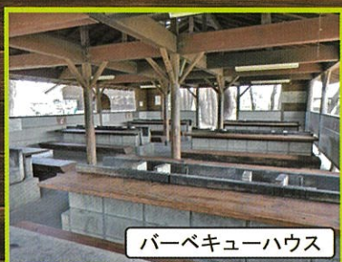
バーベキューハウス