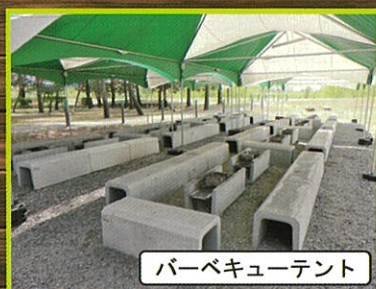
バーベキューテント