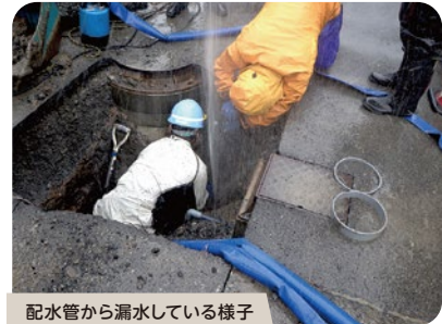
配水管から漏水している様子

今後も、安全・安心な水道水を将来にわたって安定的に供給し、健全な水道事業経営を継続するため、令和8(2026)年4月1日から水道料金を値上げしました。同年6月検針分から、値上げ後の料金でご請求いたします。