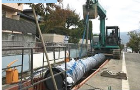
令和2年度 配水本管耐震化工事の様子