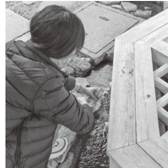
市内外から大勢の利用者

ど、人材が増えたことによる相乗効果も見えてきました。また「モーニング会」といった懇親会などで相互のコミュニケーションを深めつつ、まだまだ増員し、活動回数も増やそうと意気盛んです。