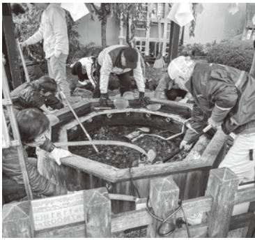
枠を外して玉砂利の清掃が大切

参加者の内、20人が第二地区以外です。企業や学校関係者の参加のほか「鯛萬の井戸お掃除隊」とお互いの活動に参加し合う連携も図られ、活動の広がりを見せています。作業内容としては、井戸の中の玉砂利の藻を取りながらの清掃が大変です。しかし、水中ポンプの使用で作業の効率化を提案する人が現れるな