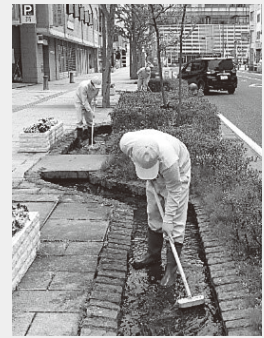
見違えるほどきれいに!

伊勢町通りの歩道両側には、せせらぎがあります。伊勢町商店街振興組合が維持管理を担い、近年では外部委託による清掃を行っていました。ところが、令和5年3月に組合が解散し、伊勢町1・2丁目町会が引き継ぐこととなりました。しかし、清掃を町会で実施するにあたり、高齢化や人手不足といった課題に直面することとなりました。