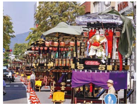
神道祭の曳行展示 壮麗に並ぶ舞台

本町一丁目、伊勢町一丁目、三丁目、博労町、中町一丁目、中町二丁目、中町三丁目、西五町、西長沢町、中条中、博労町、新伊勢町、神明町、国府町、西五町、西長沢町、中条中、博労町、中町一丁目、中町二丁目、中町三丁目、伊勢町一丁目、伊勢町二丁目、伊勢町三丁目、分銅町、第一地区公民館