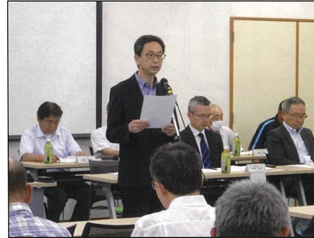
あいさつを行う奥原会長