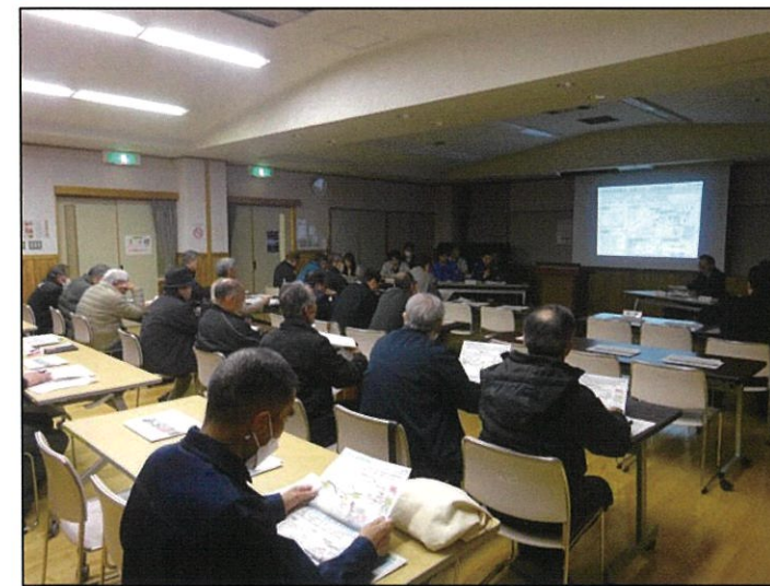
新村地区対策委員会の様子 (令和8年3月10日)

沿線4地区（島立・和田・新村・波田）の対策委員会が令和8年3月9日から12日にかけて開催されました。松本波田道路をはじめ、関連事業である松本環状高家線（仮称）新村バイパスや追加IC、中部縦貫自動車道先線（波田～中ノ湯）の状況について、各事業者から説明を行いました。