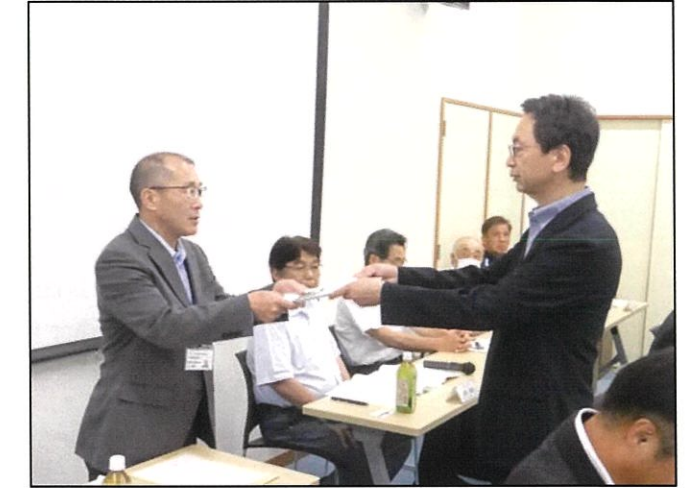
長野国道事務所へ要望書を手交