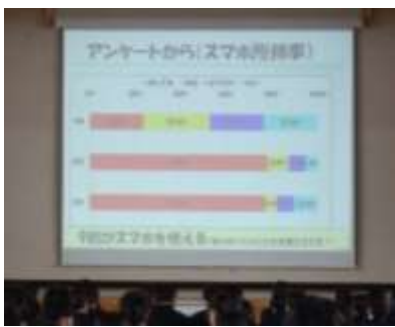
明善中生徒のスマホ使用状況