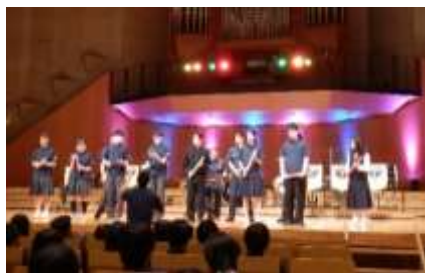
ドレミパイプを使った演奏体験

5月15日(金)に松本市音楽文化ホールで鑑賞音楽会があり、「PPP★BRASS」による打楽器の演奏を鑑賞しました。なじみのある「信濃の国」や「ドレミの歌」、「トルコ行進曲」などが演奏され、楽しいパフォーマンスが満載のコンサートでした。メンバーの皆さんの演奏だけでなく、客席の生徒たちが一緒に手拍子をして、公演を盛り上げました。代表生徒たちによる体験コーナーなども、印象に残る一場面でした。すばらしい音楽ホールで一流の音楽を満喫することができた一日となりました。