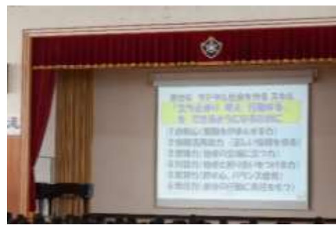
幸せなデジタル社会について考える時間

生徒たちは真剣な表情で話を聞き、自分自身のスマートフォンの使い方を見直すよい機会となりました。また、保護者の皆様にとっても、ご家庭でのルールづくりや声かけの大切さを改めて考える機会となったようです。