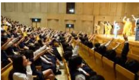
身体全体を使って音楽を楽しむ生徒たち