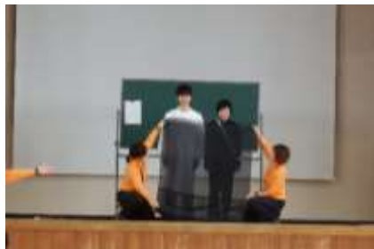
暗い道で判別しやすい色の、実演指導