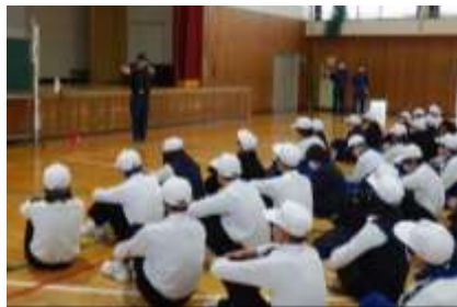
消防署の方の話を聞く生徒たち

4月には、安心・安全な学校づくりの一環として、様々な活動がありました。4月15日(水)には、避難訓練を実施し、教室からの避難経路を確認し、火災に備えた対策を考えました。消防署の方々を講師にお迎えし、煙が発生しているときの避難方法や、防火扉の仕組み等についても教えていただきました。4月13日(月)には、交通安全教室を実施し、交通安全教育支援センターの指導員の方々から歩行時や自転車乗車時に気をつけたいことを教えていただきました。夕暮れ時から夜にかけて、事故が多くなる時間帯に、事故を予防できる服装や装備について、代表生徒に実演をしてもらいながら説明していただきました。また、自転車の乗り方や整備項目について、体育館で実際の道路のイメージをもちながら、自転車の走行場面を見ることで、安全な自転車の乗り方について理解を深めました。