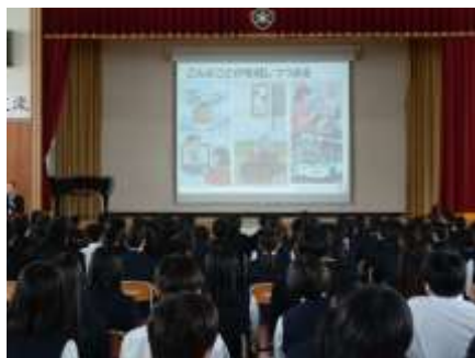
情報リテラシー講演会の様子

スマートフォンやインターネットは、今や私たちの生活に欠かせない便利な道具です。しかし、その一方で、使い方を誤るとトラブルにつながる危険性もあります。講演会では、スマートフォンとの上手な付き合い方について、具体的な事例を交えながら分かりやすくお話しいただきました。特に、「文字だけのやり取りによる誤解や人間関係のトラブル」や「長時間利用による生活習慣の乱れや学力の低下」、「インターネット上の情報を正しく判断することの大切さ」について丁寧に話しいただき、身近に起こりうる内容について学びました。