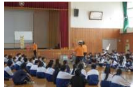
自転車の安全な乗り方を考える生徒たち

4月30日(木)の授業参観日に、メディアラシー講演会が行われました。事前に生徒たちが回答したアンケート結果をもとに、本校の生徒のスマホ所有率や、その使い方、使用時間等について紹介していただき、本校の実態を考えながら情報機器の使い方についてお話を聞きました。