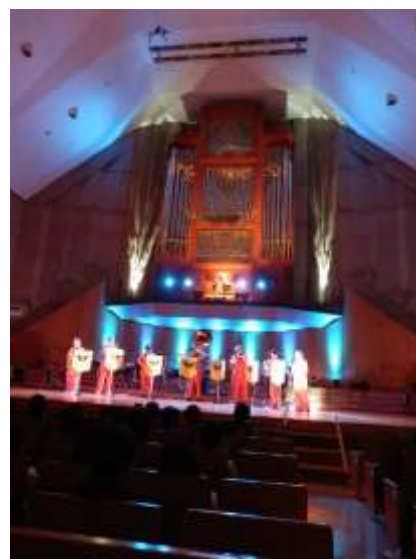
パイプオルガンと一緒に演奏する様子