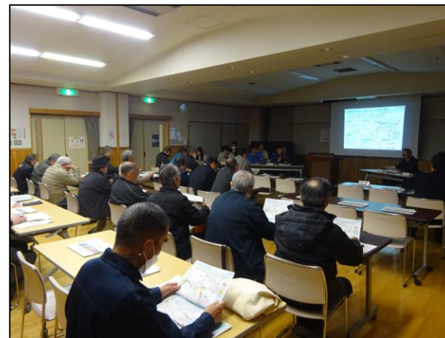
新村地区対策委員会の様子 (令和8年3月10日)

沿線4地区（島立・和田・新村・波田）の対策委員会が令和8年3月9日から12日にかけて開催されました。松本波田道路をはじめ、関連事業である松本環状高家線（仮称）新村バイパスや追加IC、中部縦貫自動車道先線（波田～中ノ湯）の状況について、各事業者から説明を行いました。