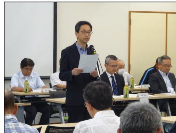
あいさつを行う奥原会長