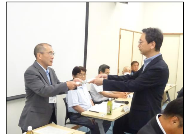
長野国道事務所へ要望書を手交