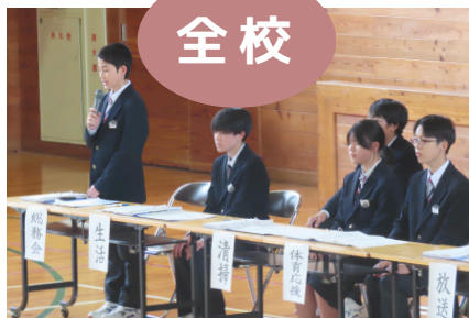
各委員会へ質問・意見