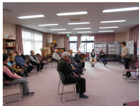
（男人(おとな)のカフェ）