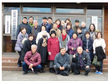
（山梨県立防災センター前）