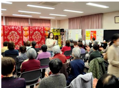
（おしゃべりカフェ）