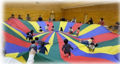
主運動(バルーン)の様子