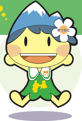
松本市マスコットキャラクター「アルプちゃん」▶

みなさんは毎日の生活の中で水道の水で手や顔を洗ったり、道路を歩いて学校へ行って勉強したり、公園で遊んだり、図書館に行って本を読んだりしているよね。