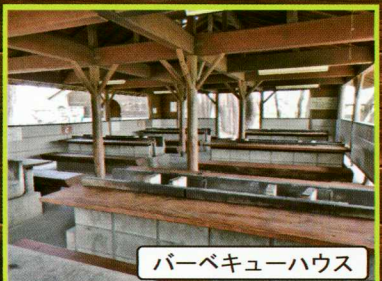
バーベキューハウス

※特盛セット・贅沢セット注文の場合、中学生以上は全員の注文、小学生は半数以上の注文が必須となります。セットをご注文いただかないお子様の備品はございません。また、席料が発生致します。 ※ドリンクの事前お預かり、保冷はお断り致します。 ※BBQ施設は雨天時に吹き込む可能性があります。雨天対策は各自にてご対応ください。 雨天によるキャンセルは出来かねますので予めご了承ください。お客様判断により中止される場合は食材のみのお渡しとなります。