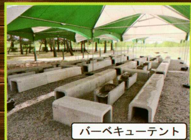
バーベキューテント