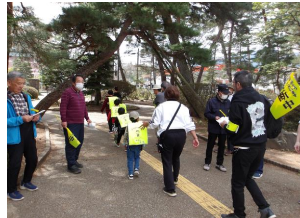
(見守り活動の様子)

現在、波田地区学校応援団は、52名11団体です。下校時の見守りのほか、給食時における交流ボランティアなどの教育活動支援も行っています。活動にご協力いただける方は、まちづくり協議会へご連絡ください。