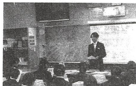
新入生、初めての学活

4月7日（火）、101名の新入生を迎え、入学式・始業式を行いました。今年も少し肌寒い気温でしたが、新入生の頑張ろうという気持ち、そして2・3年生の新入生を支えようとする気持ちがあった入学式・始業式となりました。そろそろ1年生の皆さんは学校生活に慣れたでしょうか。様々なことが始まるこの時期に、次のような生活のあゆみを書いてくれた1年生がいます。