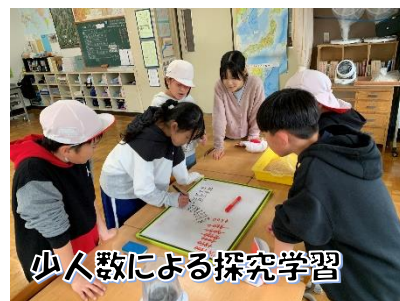
少人数による探究学習