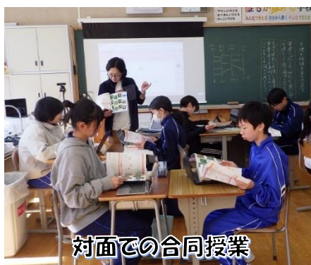
対面での合同授業