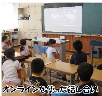
オンラインを使った話し合い

R7年度より、大野川小中学校、奈川小中学校と共に、ウェルビーイング実践校TOCO-TON（トコトン）に指定されました。「やりたい」を「ともに」を合言葉に、3校で合同学習を行ったり、交流行事を行ったりしながら連携を深め、新しい学びの姿を模索しています。