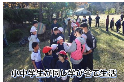
小中学生が同じ学び舎で生活