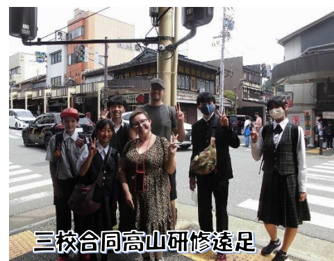
三校合同高山研修遠足