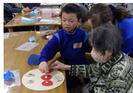
いいら（デイサービス）との交流