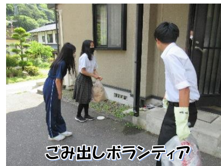
ごみ出しボランティア