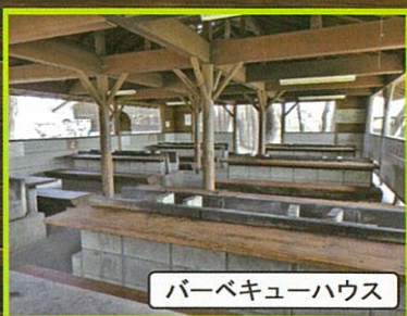
バーベキューハウス

※特盛セット・贅沢セット注文の場合、中学生以上は全員の注文、小学生は半数以上の注文が必須となります。セットをご注文いただかないお子様の備品はございません。また、席料が発生致します。 ※ドリンクの事前お預かり、保冷はお断り致します。 ※BBQ施設は雨天時に吹き込む可能性があります。雨天対策は各自にてご対応ください。 雨天によるキャンセルは出来かねますので予めご了承ください。お客様判断により中止される場合は食材のみのお渡しとなります。