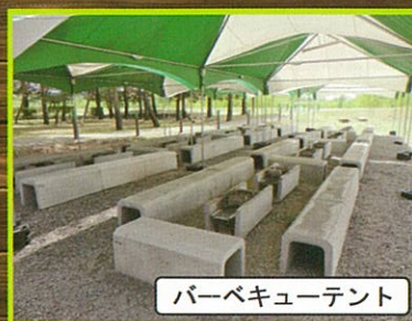
バーベキューテント