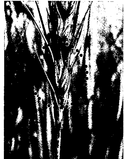
赤丸内（褐変している部位） が赤かび病感染部位