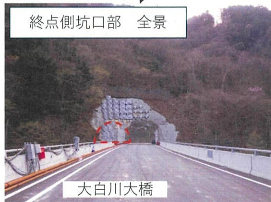
■終点側坑口部 大白川大橋から見た坑口部全景