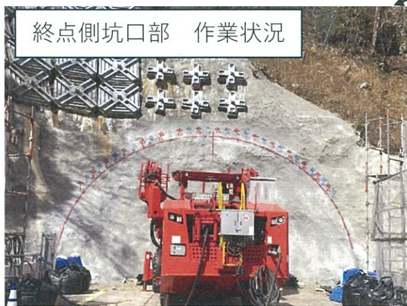
終点側坑口部 作業状況