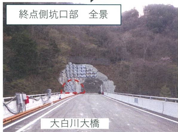
終点側坑口部 全景