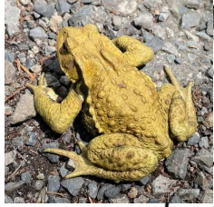
上高地で7月に見つけた婚姻色のアズマヒキガエル