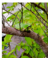
樹上のアマガエル