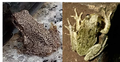
アマガエルの擬態