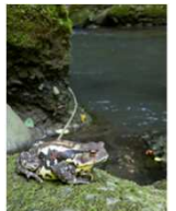
アズマヒキガエル