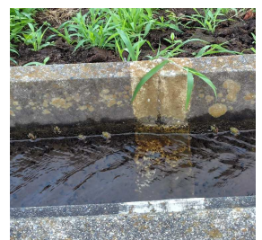
側溝の中のたくさんのトノサマガエル