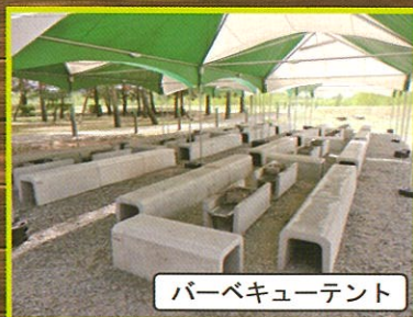
バーベキューテント