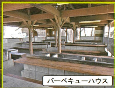
バーベキューハウス