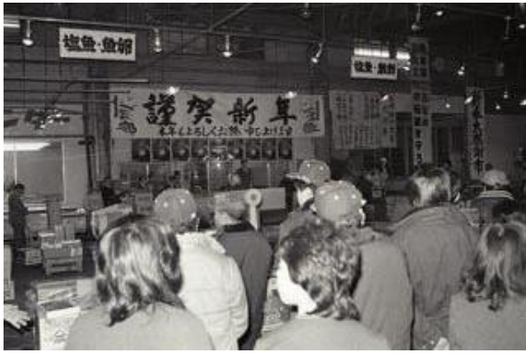
【写真2 初市 6 】