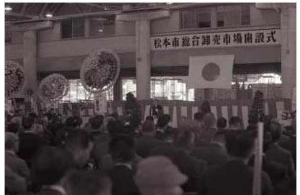
【写真1 松本市総合卸売市場の開設式 3 】

旧市場は、南松本の総合団地内に所在し、都市計画上は「松本市総合卸売市場（大字芳川平田・69,400㎡）」として整理されていきました。昭和47年12月には、卸売市場法の施行に伴い、長野県知事から地方卸売市場の開設及び卸売業務の許可を受けました 5 。