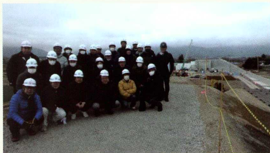
松本波田道路(新村高架橋)

各視察箇所、長野国道事務所、松本建設事務所、NEXCO中日本、松本市の担当者から事業計画等の説明を受け、施工方法や事業進捗について理解を深めました。