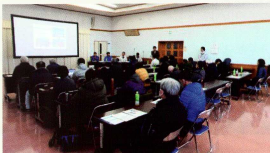
事業説明(梓川支所)

松本市における先線の検討状況について、市から国に対して、先線区間におけるインターチェンジの候補地として、「沢渡周辺」と「水殿周辺」の2ヶ所を提案するとの説明がありました。