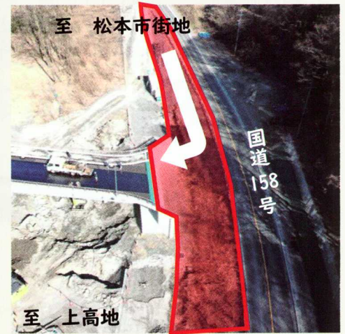
国道取り付け部施工範囲