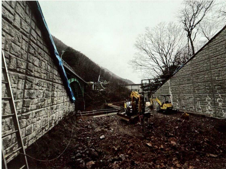
①土留めパネル設置状況 (松本市街地側)

施工箇所は急峻な地形で、かつ直下に河川があるため、土留めのパネルを設置しながら垂直に掘削を行う、狭小な箇所での施工に適した特殊な工法が採用されています。