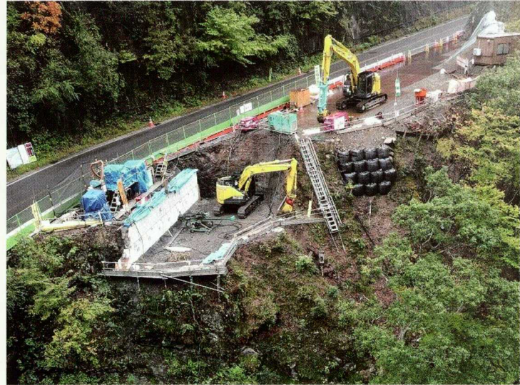
②下部工施工状況 (上高地側)