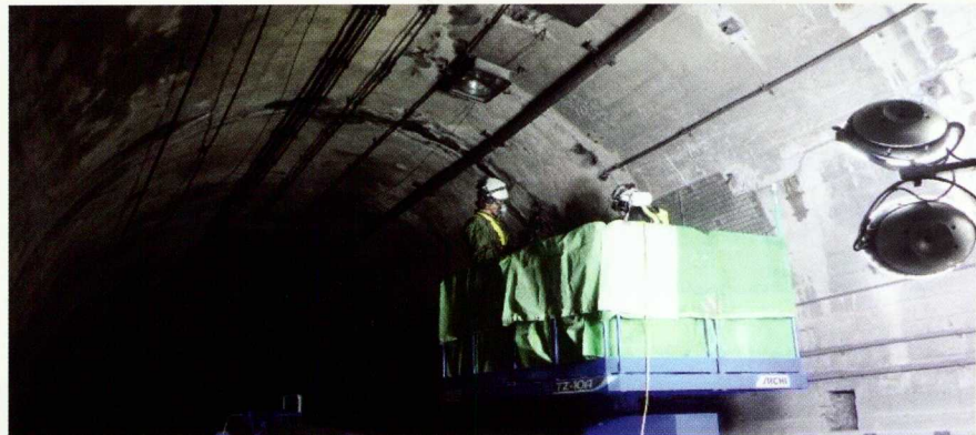
新入山隧道補強工事 (新入山トンネル掘削のための準備工) 施工状況