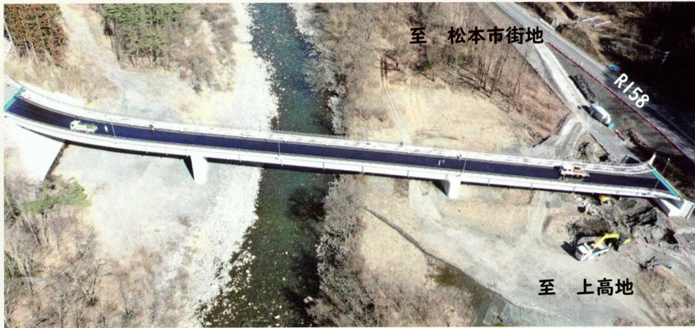
令和8年3月撮影写真

令和8年3月に上部工事が完了し、橋の両側との取り付け工事を残すのみとなりました。国道158号には、松本市街地側に右折レーンが設置され、上高地方面へ向かう直進車両のスムーズな交通が確保されます。