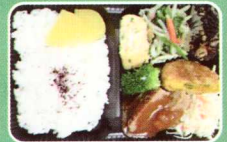
ハンバーグとちまこコロッケ