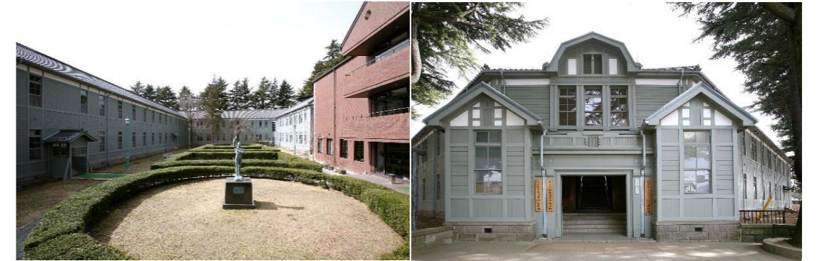
重要文化財 旧松本高等学校 本館・講堂