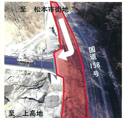
国道取り付け部施工範囲