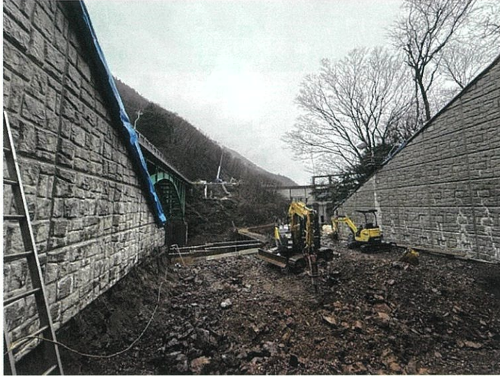
①土留めパネル設置状況 (松本市街地側)

施工箇所は急峻な地形で、かつ直下に河川があるため、土留めのパネルを設置しながら垂直に掘削を行う、狭小な箇所での施工に適した特殊な工法が採用されています。