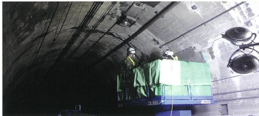
新入山隧道補強工事 (新入山トンネル掘削のための準備工) 施工状況