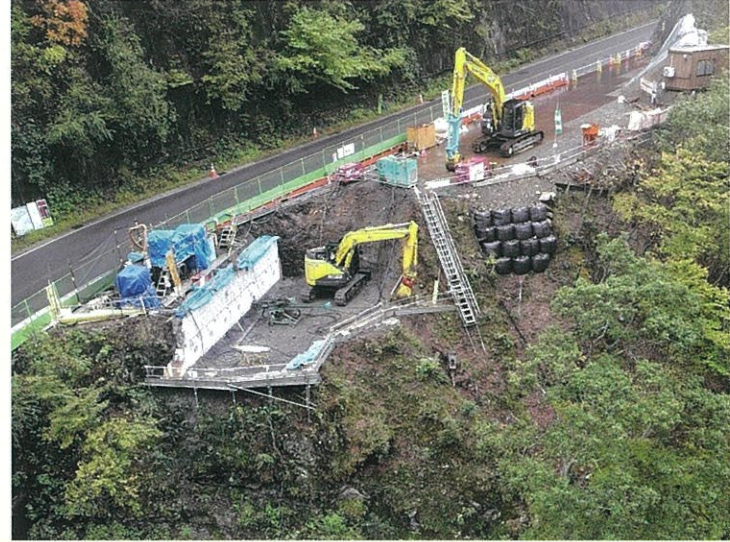
②下部工施工状況 (上高地側)