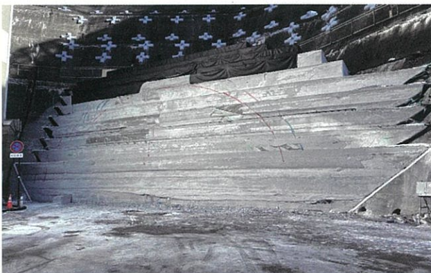
新入山隧道エアモルタル工事 施工状況

新入山隧道を通行止めにして、ダム側坑口の法面補強工事や、新入山トンネルの掘削工事に向けて、隣接する新入山隧道の補強工事が実施されています。掘削に向けた調査を実施した後、上高地の開山祭までに、交通規制を解除します。