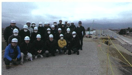
松本波田道路(新村高架橋)

各視察箇所、長野国道事務所、松本建設事務所、NEXCO中日本、松本市の担当者から事業計画等の説明を受け、施工方法や事業進捗について理解を深めました。