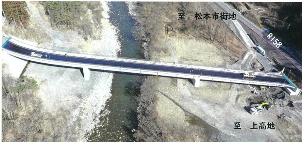
令和8年3月撮影写真

令和8年3月に上部工事が完了し、橋の両側との取り付け工事を残すのみとなりました。国道158号には、松本市街地側に右折レーンが設置され、上高地方面へ向かう直進車両のスムーズな交通が確保されます。