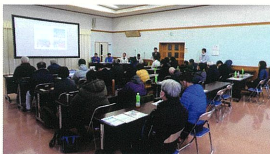
事業説明(梓川支所)

松本市における先線の検討状況について、市から国に対して、先線区間におけるインターチェンジの候補地として、「沢渡周辺」と「水殿周辺」の2ヶ所を提案するとの説明がありました。