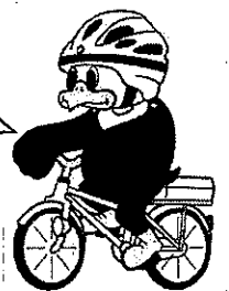
長野県警察マスコット 「ライホくん」