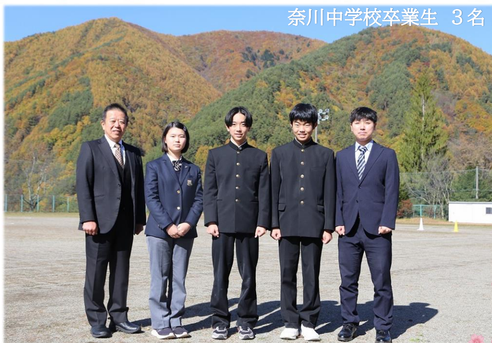
奈川中学校卒業生 3名