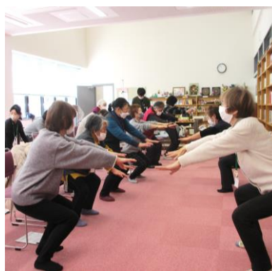
2/13 「ふれあい健康教室」 (フレイル健診)の様子