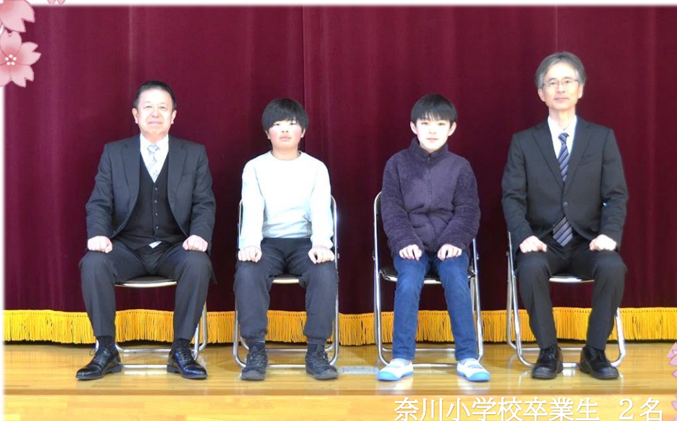
奈川小学校卒業生 2名