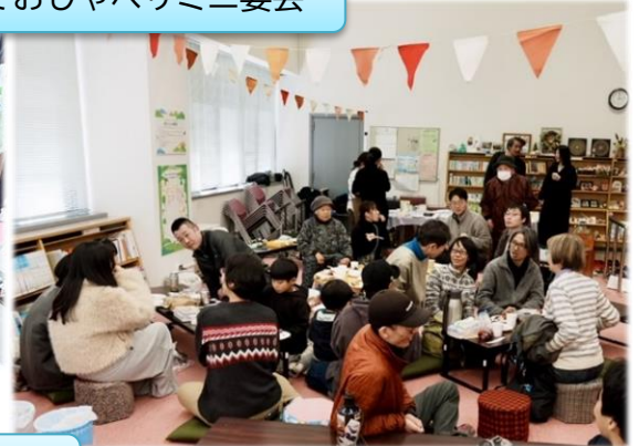
出張！洋服循環フリマ (ロイダッツ)