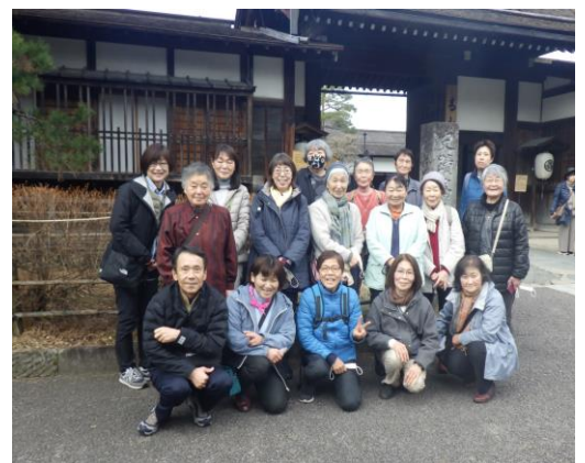
3/6 「大人の社会見学」(高山市) 高山陣屋前にて