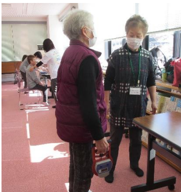
握力測定・5m歩行 パタカ測定など