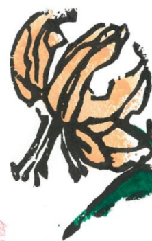
野口 聡子作「夏の始まり」