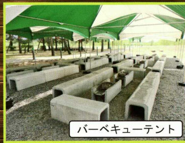
バーベキューテント