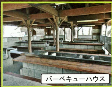
バーベキューハウス

セットメニューには食材・タレ・備品「炭・網・取り皿・割り箸・コップ・焼きそば用プレート」施設使用料が含まれます。(備品・タレ等の追加は別途料金が発生致します)