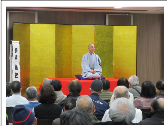
(新春「波田落語会」の様)

来場者からは、「時間が経つのを忘れるほど引き込まれた。」「心から笑えてストレス解消になった。」などの感想も。生で見る落語の迫力と魅力、奥深い世界を充分堪能することができ、会場は終始笑いの渦に包まれていました。