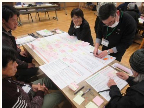
グループごとの意見出し・共有

第4回ワークショップでは、これまでに出された意見をもとに取りまとめた「あがたの森通り再整備計画（素案）」を提示しました。事務局からの素案の説明後、4つのテーマごとに整理された再整備方針の内容について、共感・賛同できることと、追加したいこと（課題や提案）の意見を共有するワークを行いました。