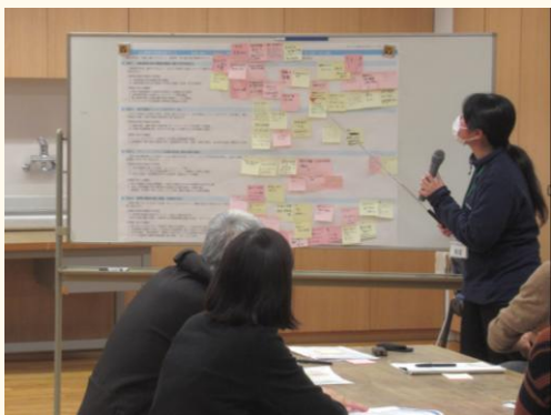
全体での意見の共有