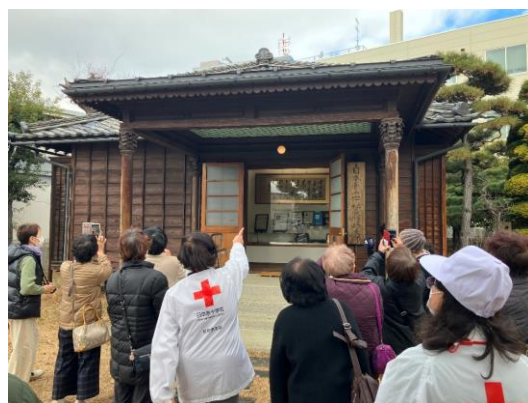
(歴史資料館を見学する様子)

これまで困難な時代も乗り越え、地域に根差した活動を行ってきた日赤の歴史を振り返ることができ、団員一同、深く感銘を受けると同時に、大きなやりがいと誇りを感じた一日でした。